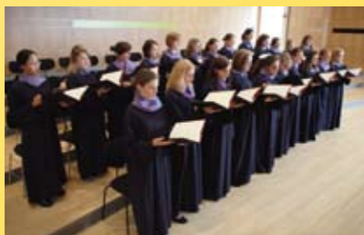
Domkapelle St. Eberhard Stuttgart

Konzertchor der Mädchenkantorei an der Domkirche St. Eberhard Stuttgart